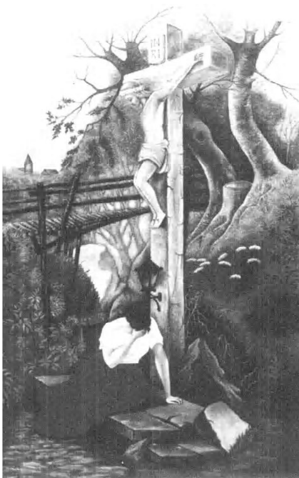
Hegyellai Imre festménye

• II. évf., 1. (2.) szám • 2004. február 22.