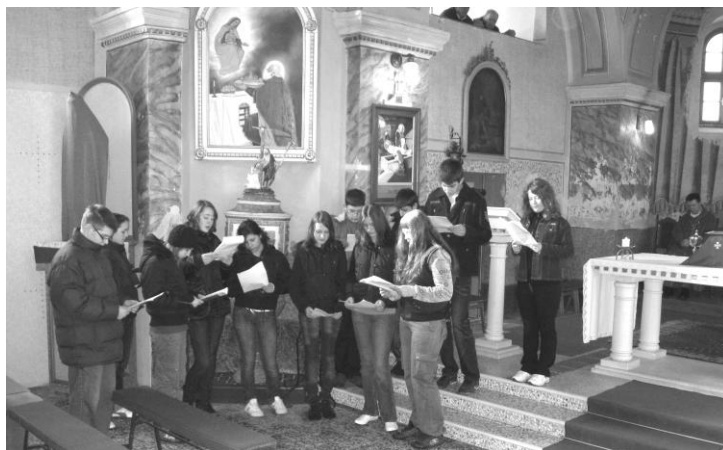
Urunk Jézus Krisztus kínszenvedésének történetét, a passiót az idén a felsős hittanosok előadásában láthattuk-hallhattuk a virágvasárnap szentmisén.