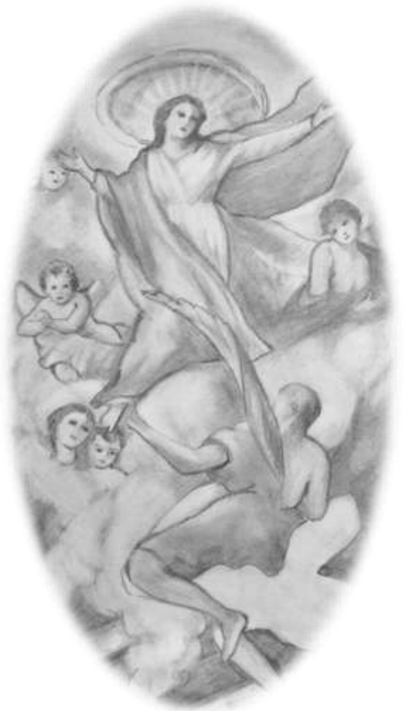
Hegyllai Imre rajza

Mellette biztosak vagyunk abban, hogy betegeink, a lelki betegek is meggyógyulnak, mindnyájan és oda jutunk, ahova vágyunk, a mennybe. Nagyboldogasszony napja igazán nagy ünnep, egyike a négy parancsolt ünnepnek, amikor kötelességünk elmenni a templomba, a szentmisére. Menjünk is boldogan templomba, Mária szép kegyhelyére. Gyermeki bizalommal kérjük mennyei édesanyánkat, hogy kegyelmet nyerjünk Istennél, mert erős Istennél az ő szava, már sokaknak kiesdekelte sok mennyei adományt. Hígyjük, hogy nekünk is kiesdi, azért menjünk, találkozzunk vele augusztus 15-én.