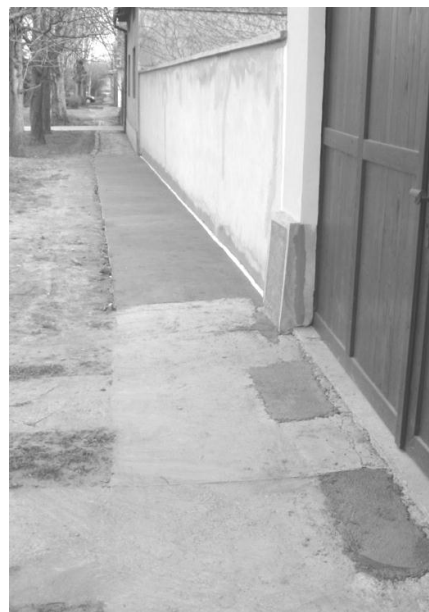
A régi és az új járda