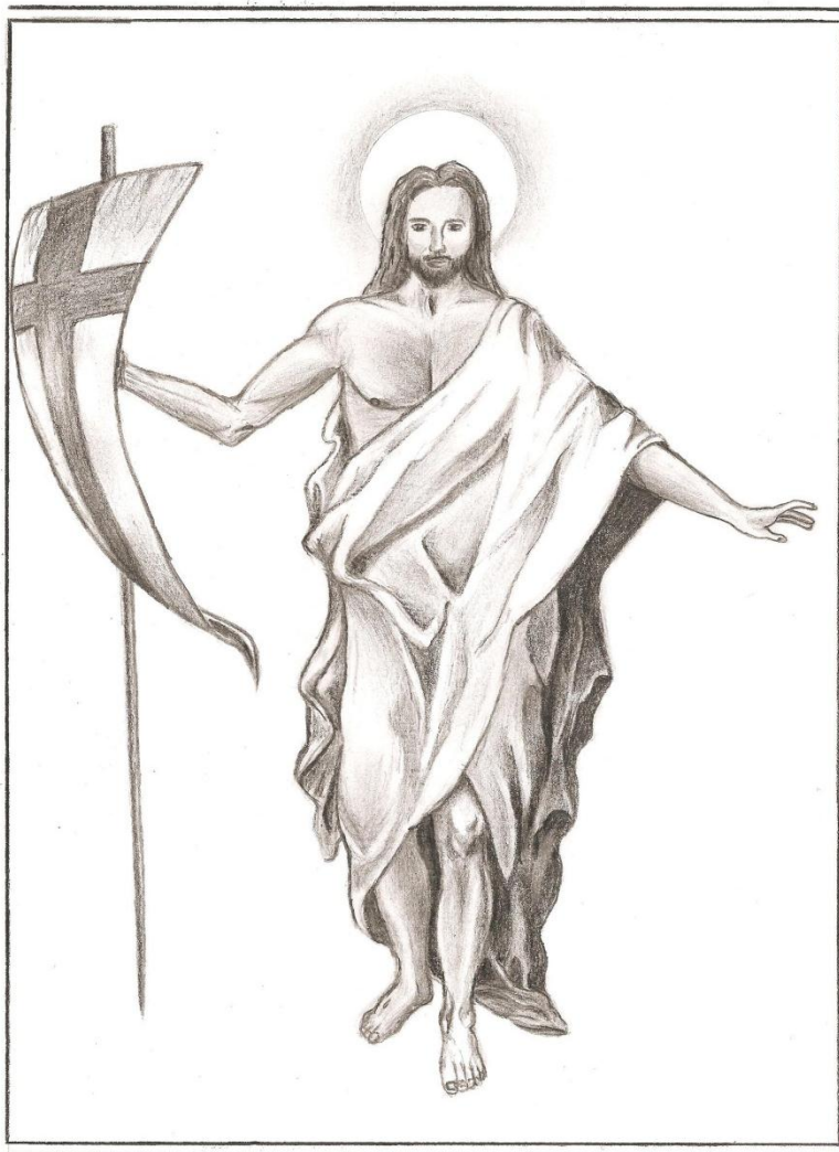
Kókity Lilla rajza (2012)

„Tudom, hogy Üdvözítőm él, és én az utolsó napon föl fogok támadni!”, azaz tudom, hogy rám is a nyomorúság, szenvedés, elhagyatottság órái után az örökkévaló boldog hazának soha le nem alkonyodó napja föl fog virradni, amikor a feltámadott Jézus örömeiben részt vehetek. Korunknak, amely mindinkább az anyagiasság hitetlen elveihez szegődik, és amelyben olyan kevés azoknak a száma, akik a földiek fölé emelkedve az égiekben keresik üdvüket, kérjük Istent, hogy erősítse hitünket, nehogy a veszedelem óráiban, kísértésben elveszítsük a talajt, és a hitelenség és bűn tengerében elmerüljünk! A feltámadott Krisztus fönséges titka tanítson minket arra, hogyan kell hitünkben állhatatosan kitartanunk és reményünkben erősödnünk. Ilyen gondolatokkal minden kedves hívőnek áldott húsvétot kívánok!