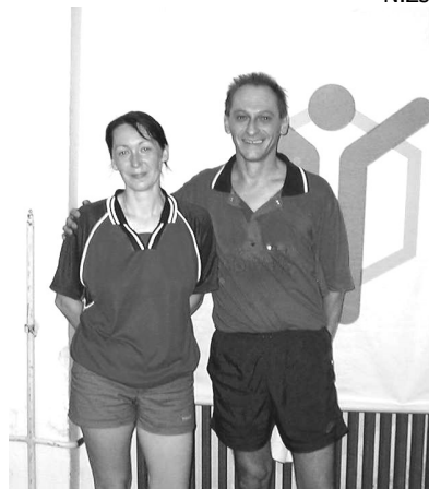
Az egyéni versenyszámok győztesei